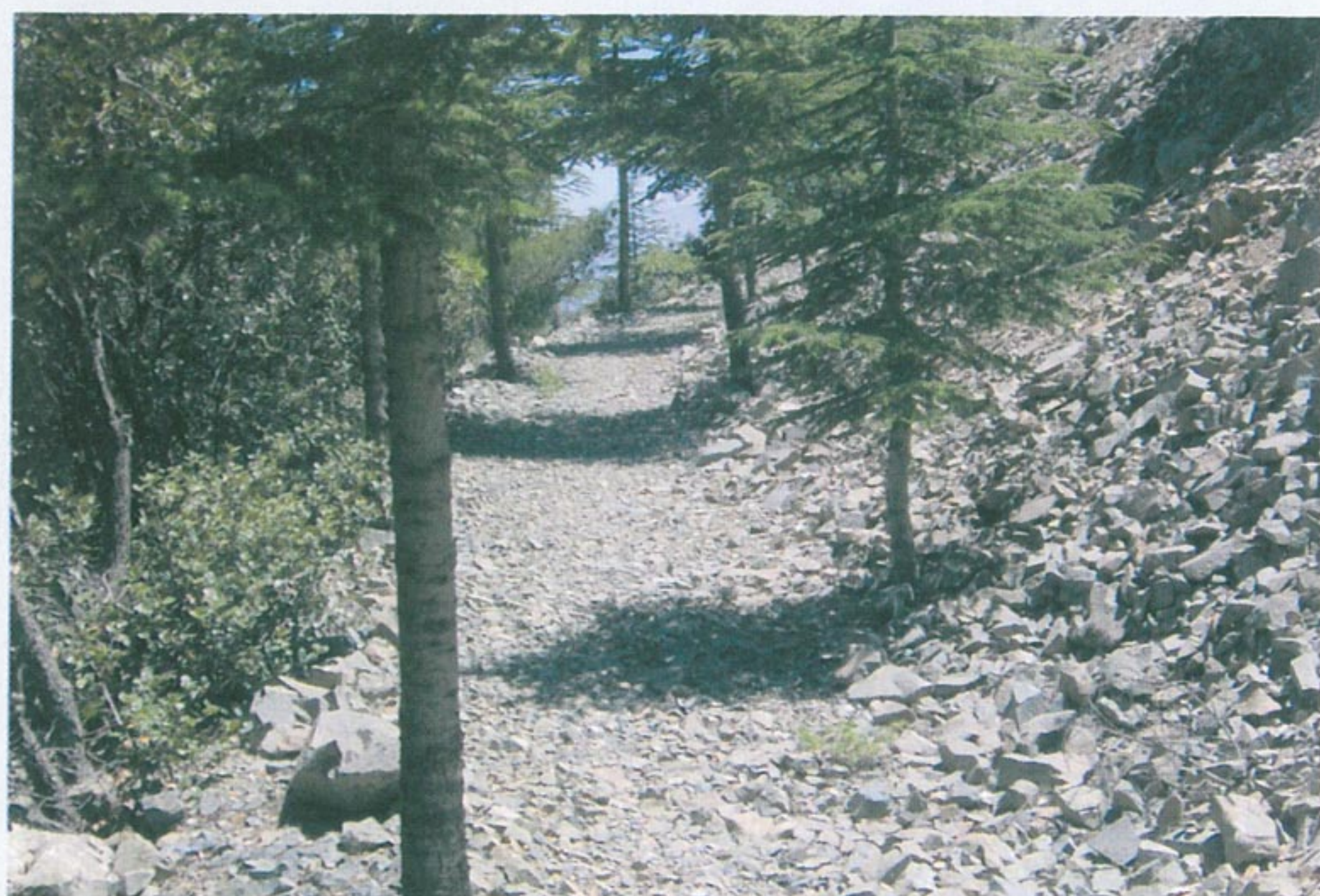
Τμήμα Μονοπατιού της Μαδαρής

Η τοποθεσία Δόξα Σοι Ο Θεός βρίσκεται σε απόσταση 2 χιλιομέτρων από την Κυπερούντα και 5 χιλιομέτρων από τα Σπήλια στο δρόμο Κυπερούντας - Σπηλιών - Κανναβιών, σε υψόμετρο 1335m. Η πορεία του μονοπατιού παρέχει τη δυνατότητα στον πεζοπόρο να επιλέξει αφετηρία και πορεία που επιθυμεί να ακολουθήσει.